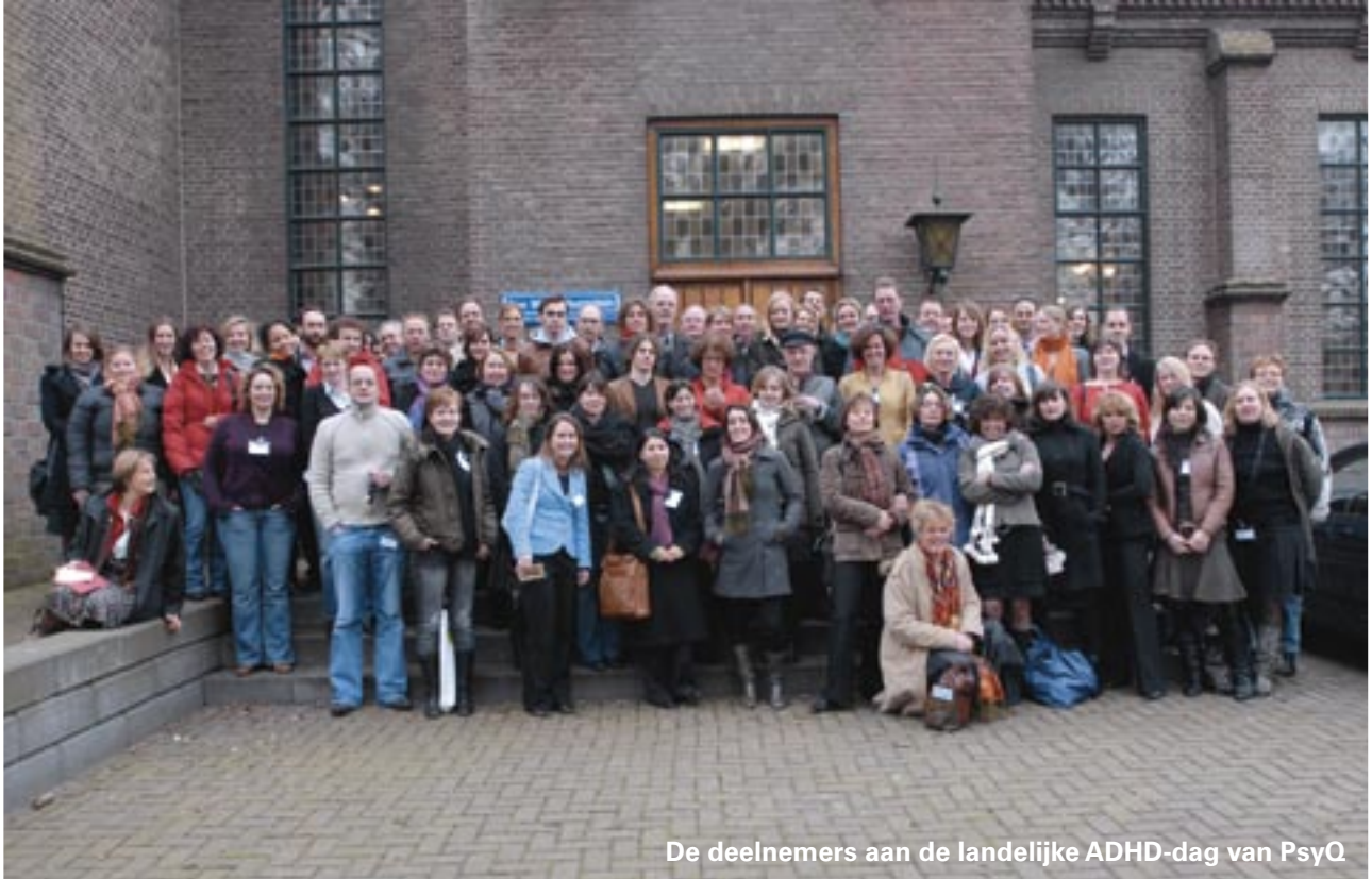
De deelnemers aan de landelijke ADHD-dag van PsyQ

zonder slaapproblemen. Kooij: "De uitkomsten van dit onderzoek bevestigen het vermoeden dat slaapproblemen bij ADHD verband houden met een verlate melatonineproductie (zie Impulsief januari 2008, 'Klaas Vaak komt te laat'). Er zijn echter nog andere onderzoeken nodig om de effecten van melatoninebehandeling aan te kunnen tonen."